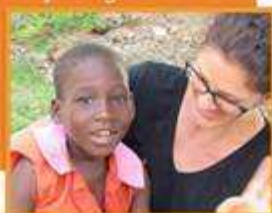
Equipo de Trabajo CISM

Hace unas semanas que llegué a Mozambique, y son muchas las sensaciones que aparecen durante este tiempo de adaptación, pero la sensación que más destaca estos días, que se repite, una, otra y otra vez es la de "dependencia". Últimamente bromeo mucho diciéndole que estoy en preescolar, es como me siento. Esa sensación de depender de los demás para todo, el no poder expresarme bien y conseguir hacerme entender, el no saber ir a los sitios, tener que preguntarlo todo... esa sensación me recuerda continuamente mis debilidades, me ayuda a recordar la necesidad que tengo de Dios y de los demás. Y me muestra a cada paso que doy como Dios tiene el control de todo.