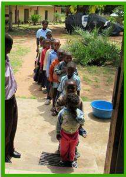
Tiempo de comer

La lista de enfermedades es más larga de lo que yo pensaba, en algunos de los casos tienen varias problemáticas juntas. Todos los niños están juntos y los cuidadores no tienen una formación específica para cada una de las enfermedades con las que trabajan. Tienen mucho amor hacia los niños pero les falta formación y recursos para poder trabajar con ellos. Algunos de los niños no pueden asistir al centro porque solo hay un coche y no puede recoger a todos los niños, sobre todo cuando llueve.